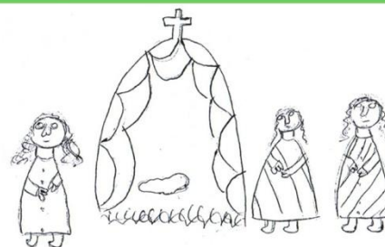
„I ZMARTWYCHWSTAŁ TRZECIEGO DNIA”